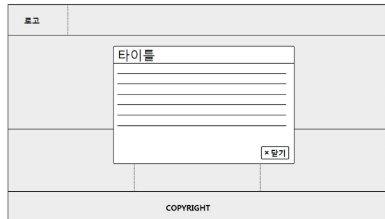
<모달 레이어 팝업창 제작>