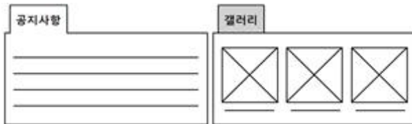
<공지사항, 갤러리 별도 구성>